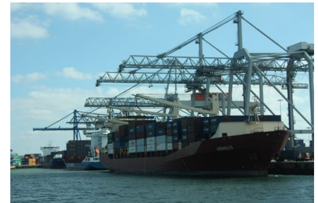
Carga y descarga